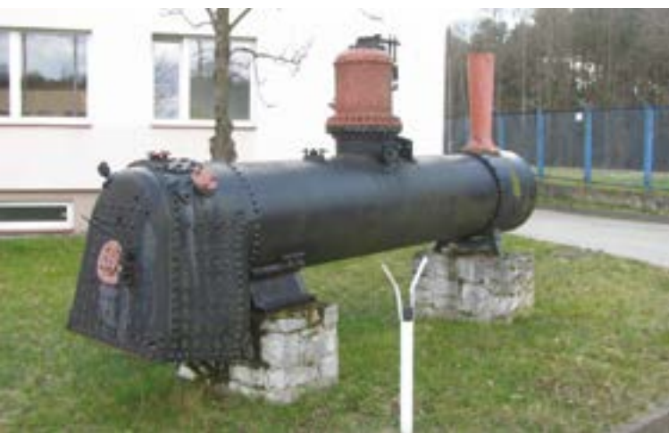
Kocioł parowozu „HF” Tx-1125 wyeksponowany jako pomnik w Kielcach, 2016 r.