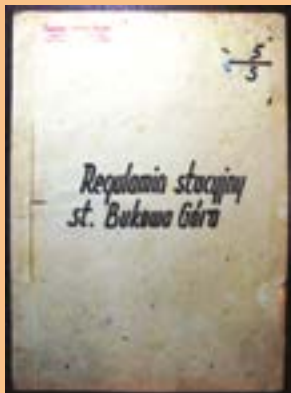
Regulamin stacji Bukowa Góra z lat 50-tych.