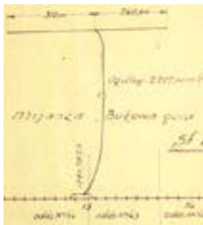
Bocznica Bukowa Góra (schemat linii z 1933 r.).