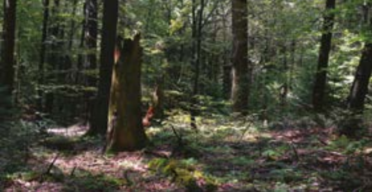
Puszcza Jodłowa